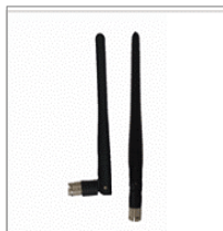
ダイポールアンテナ (option)